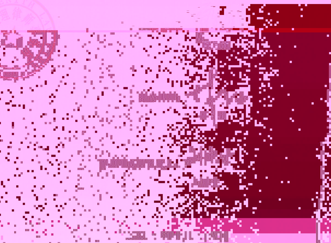
Figure 1: Trend of COVID-19 cases from January 2020 to March 2022. The graph displays the number of cases (例数) over time (日期). The x-axis is labeled with months from 1月 (January) to 3月 (March) for each year. The y-axis represents the number of cases, ranging from 0 to 100,000. The data shows a significant peak in early 2020, followed by a period of low activity. A second major peak occurs in late 2021, reaching about 80,000 cases. A third, smaller peak is visible in early 2022, reaching approximately 40,000 cases. The overall trend shows periodic waves of infection with varying intensities.